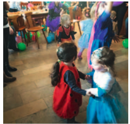
Am Faschingsdienstag veranstaltete der TSV im Sportheim einen Kinderfasching für Groß und Klein.

Jedes Kind erhielt ein Freigetränk und einen Krapfen als Überraschung. Bei Faschingsmusik tanzten die Kleinen und Großen mit Freude mit. Ein herzliches Dankeschön an Familie De Luca für die Bewirtung. Karin Helm